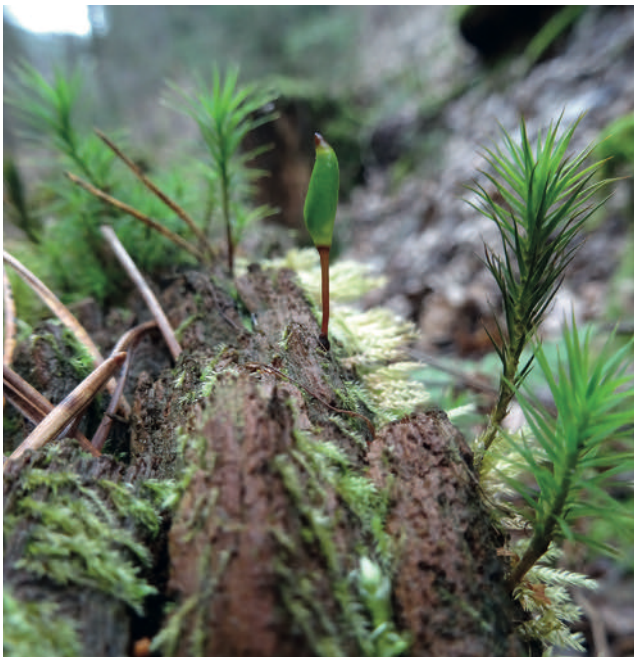
▲ Abb. 1: Buxbaumia viridis auf altem Fichten-Totholz im Langental bei Rinnthal.

Dem Autor liegen aus den zurückliegenden zehn Jahren 41 Funde des Grünen Koboldmooses aus zwölf verschiedenen Bereichen des Pfälzerwaldes vor. Wenn sich in den letzten Jahren die Gelegenheit ergab, wurden Fundorte mehrfach aufgesucht, um zu prüfen, ob sich die Vorkommen auch in Folgejahren bestätigen ließen. Dies war in einigen Fällen nicht der Fall, so dass