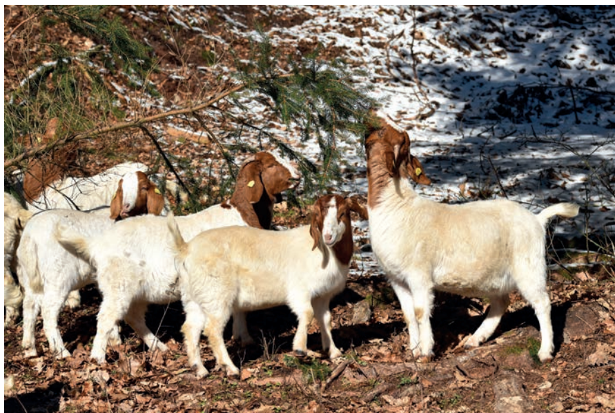
Abb. 2: Ziegen beim Verzehr von Fichten.