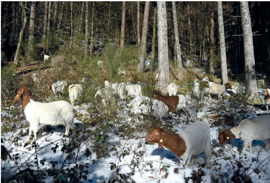
Abb. 1: Waldrandbeweidung.