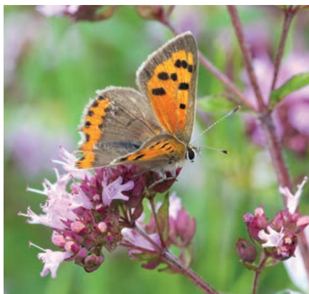
Abb. 5: ... Kleiner Feuerfalter Lycaena phlaea (Linnaeus, 1761).